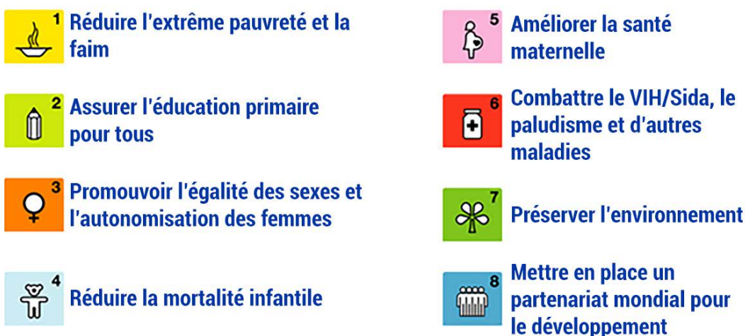
Figure 1. Les objectifs du Millénaire pour le Développement

Le soutien aux écoles dans les pays du Sud est l'un des objectifs du Millénaire pour le Développement