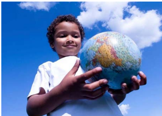
Figure 3. Couverture du Rapport «Réaliser le futur que nous voulons» 8

2015 a donc été une année cruciale avec l'adoption des Objectifs de Développement Durable, en septembre à New-York et la Conférence des Parties à la Convention-cadre des Nations Unies sur les Changements Climatiques (CdP21 ou COP21 en anglais) qui a eu lieu à Paris en novembre-décembre et qui a permis l'adoption d'un nouvel accord universel sur le climat.