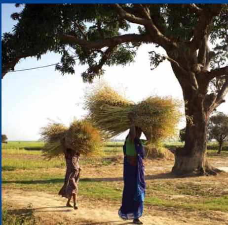
Une grand-mère et sa petite-fille rentrent de la récolte de moutarde dans le village de Belauhi, en Inde