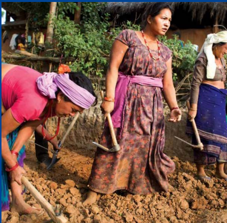
Des femmes du village de Dola (Népal) construisent un bassin pour irriguer leurs cultures maraîchères